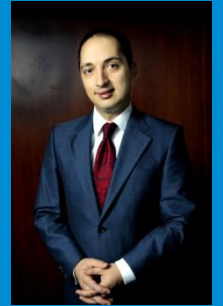
بۆتان مەحمود عوسمان سەرۆکی فەرمانگە فەرمانگە تەکنەلۆجیای زانیاری

مەبەستی ئەم بلاوکراوہیئە فەراھەمکردنی تیرامانیئکی بەسوودە لە کار و ئاراستە فەرمانگە تەکنەلۆجیای زانیاری.